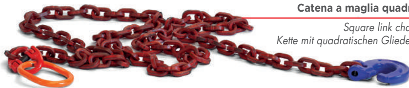
Catena a maglia quadra Square link chain Kette mit quadratischen Gliedern

DISPOSITIVO SICURO SAFE DEVICE SICHERES GERÄT